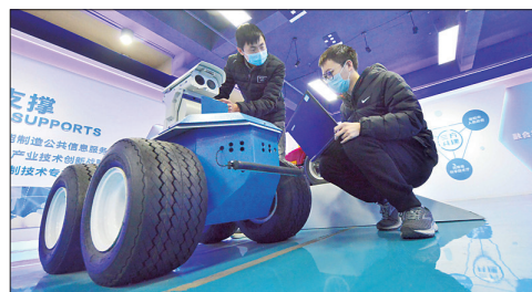
在中科院自动化研究所(洛阳)机器人与智能装备创新研究院,工作人员测试电力巡检机器人