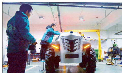
国家农机装备创新中心研制的“超级拖拉机1号”后续型号接受测试