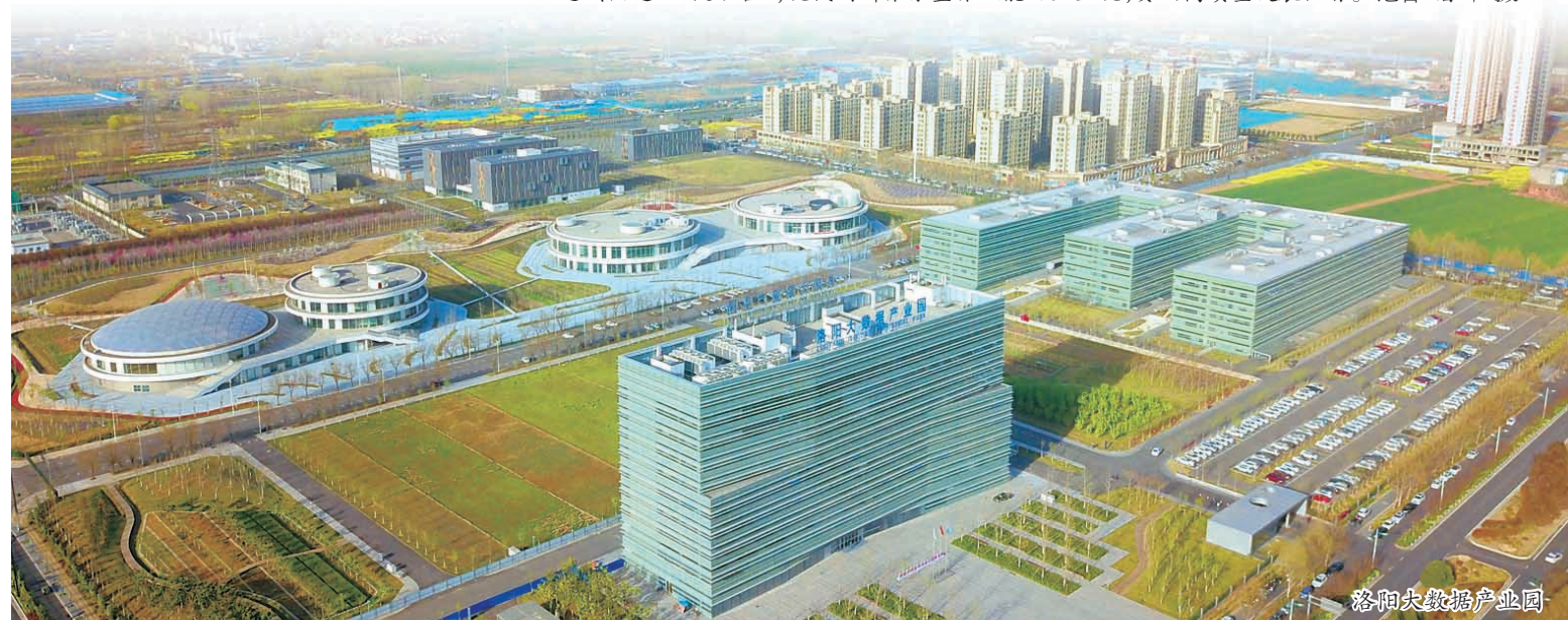
洛阳大数据产业园

“十三五”期间,我市围绕发挥优势打好创新驱动发展牌和实现科技创新能力更强奋斗目标,以郑洛新自创区洛片建设为龙头,不断强化人才支撑,着力实施“双倍增”计划,打通“四个通道”、促进“四链融合”,现代创新体系整体效能日益显现,奏响高质量发展强音。