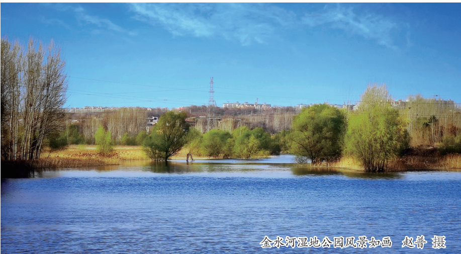
金水河湿地公园风景如画

进入四月,春光明媚。在洛阳市西部的西工红山,蜿蜒流淌的金水河像一条美丽的飘带,两岸绿树参差,花草丰茂,而蓄水量800万立方米的金水水库,水量丰盈,似一块温润的碧玉镶嵌在洛阳的西大门。 金水河,这条古老的河,洛阳市“引黄入洛”工程为地注入新活力,西工区“金水河生态公园”建设又使她焕发全新的面貌。如今的金水河,经过西工区一年来大刀阔斧的建设和精雕细琢的提升,正在成为一条生态优美、内涵丰富、前景广阔的河。