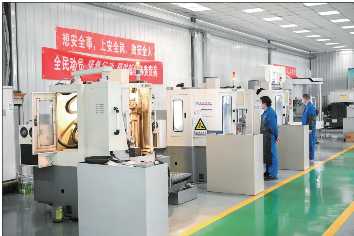
洛阳途泰精密工具有限公司加快自主创新步伐,发展高端装备制造