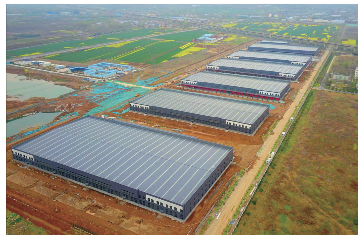
洛阳综合保税区一期19万平方米的保税仓库项目正加紧施工