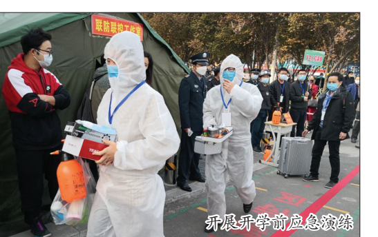
展开开学前应急演练

莫道浮云终蔽日,严冬过尽绽春蕾。抗击疫情是一场大战、大考,是考验党员干部初心使命的磨刀石。市教育局将继续深入贯彻习近平总书记关于新冠肺炎疫情防控工作的一系列重要讲话和指示精神,将中央、省、市相关决策部署落细、落小,在市委、市政府的坚强领导下,坚决打赢疫情防控的人民战争、总体战、阻击战,向党和人民交上一份合格答卷。