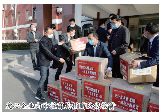
爱心企业向市教育局捐赠防疫物资

在这场战“疫”中,教育系统党员主动请缨,让鲜红党旗在战“疫”一线高高飘扬,他们充分发挥基层党组织战斗堡垒作用和共产党员先锋模范作用,严格执行各项防控措施,坚定站在疫情防控最前沿,用实际行动诠释了共产党员的初心和使命,携手在校园筑起铜墙铁壁。局属各单位共成立10个临时党组织,成立党员突击队和党员志愿服务队52个,参与突击队和志愿服务队的党员700余名,在复工复产的关键时期,他们积极到居住地社区和单位参加疫情防控工作,以实际行动争做疫情防控阻击战的“最美逆行者”,努力打造“忠诚、干净、担当”的教师队伍!