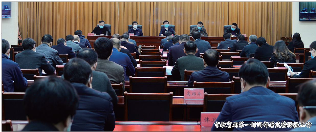
市教育局第一时间部署疫情防控工作

春暖花开,万物复苏。没有一个冬天不可逾越,没有一个春天不会到来!在大家的期盼中,省教育厅正式公布全省中小学校复学时间:高三学生将于4月7日统一返校复学,中小学校其他年级和幼儿园的复学时间不早于4月13日。