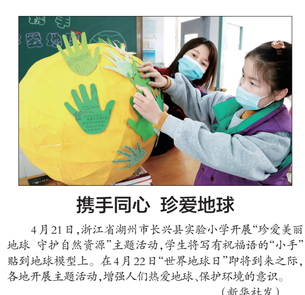
携手同心 珍爱地球 4月21日,浙江省湖州市长兴县实验小学开展“珍爱美丽地球 守护自然资源”主题活动,学生将写有祝福语的“小手”贴到地球模型上。在4月22日“世界地球日”即将到来之际,各地开展主题活动,增强人们热爱地球、保护环境的意识。