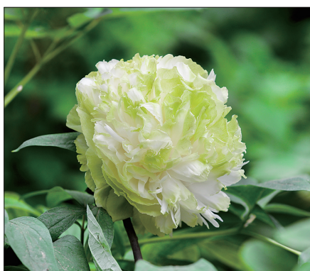
王城公园春柳牡丹

王城公园的绿牡丹,近日突然成为热门网络话题。众多市民和游客拿着相机或手机,慕名来到王城公园欣赏“网红牡丹”春柳的芳容,“绿牡丹”一下火了。到底发生了什么?