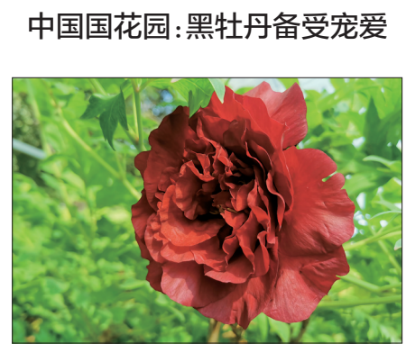
中国花园黑沙堡牡丹

黑沙堡牡丹是中国花园的骄傲,因为这个品种的牡丹是该园独有品种,主要栽植在国花园附近,目前正值盛花期,黑沙堡牡丹属于黑色系,特晚花品种。花色呈墨紫红色,花蕾圆尖形,花梗细短,花朵侧开,微藏于叶,外瓣较大,内部渐小,花丝、柱头及房衣均为墨紫红色。株型半平展,小型长叶,顶小叶深裂,侧小叶多深裂。