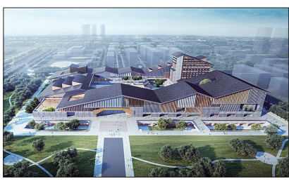
黄河流域非物质文化遗产保护展示中心效果图

看一看非遗展示馆,逛一逛非遗古街,读一读与非遗有关的书籍……未来,在黄河流域非物质文化遗产保护展示中心,游客能一站式了解、体验非物质文化遗产。我市此次开工建设的黄河流域非物质文化遗产保护展示中心,项目总投资16亿元,占地93亩,其中规划建设面积约13万平方米,将建设非遗展示馆、非遗书城、非遗学术交流中心、非遗古街等,集珍品收藏、陈列展览、活态展示、教育研学、互动体验等功能于一体。