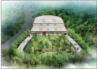
栾川竹海野生动物园熊猫馆效果图