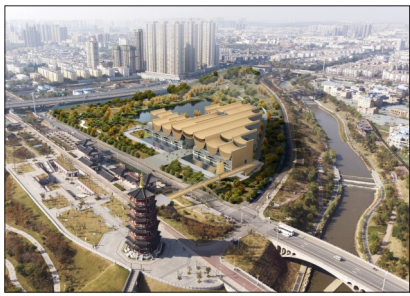
隋唐大运河文化博物馆效果图