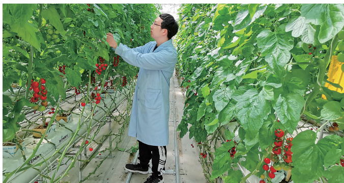
河南建业在江左镇张窑村利用沟域发展高效农业