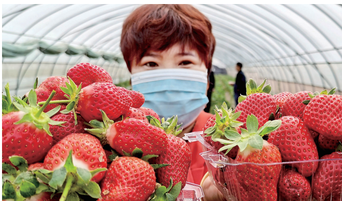
平等乡平等村村民种植草莓发展沟域经济

在技术层面,这些年,伊川聚焦肉牛、富硒小米、岭上晒薯、鹤岭花椒等特色农业主攻方向,与郑州林果所、西北农大、中国农科院、河科大等细分领域顶尖高校院所合作,设立5个专业产业研究院,有针对性地做实农业科技扶持,打开了伊川特色高效农业、富硒功能农业品牌。(下转02版)