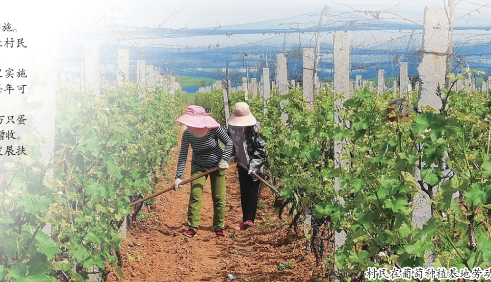
村民在葡萄种植基地劳动