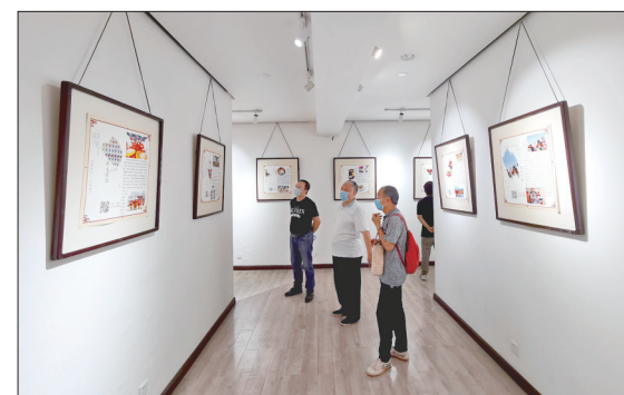
黄河非物质文化遗产开展

近日，在位于凯旋路八一路口的市图书馆老馆一楼展厅，观众在观看“黄河安澜”黄河非物质文化遗产展览。本次展览持续至6月30日，免费向市民开放。