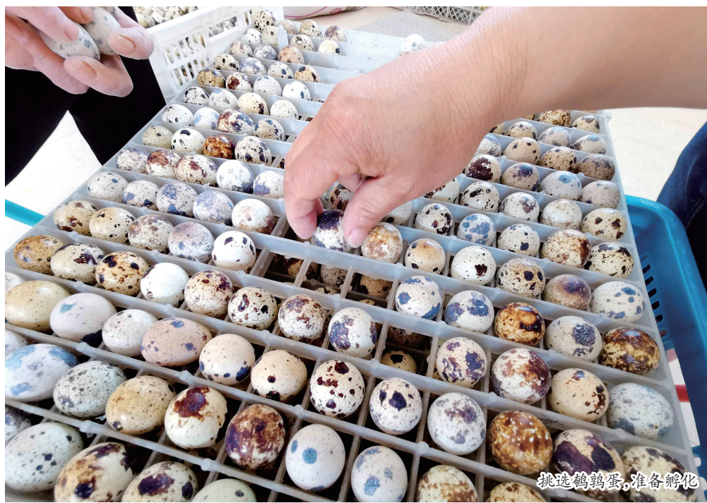
挑选鹤鹑蛋，准备孵化