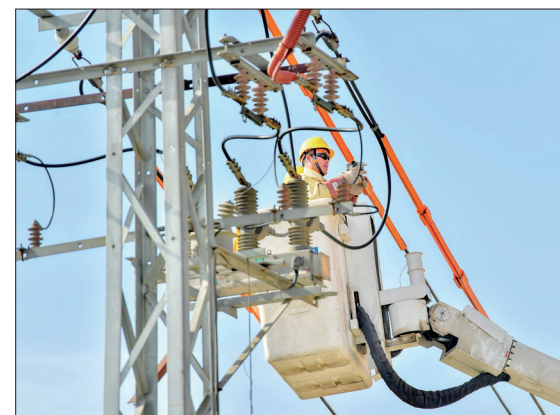
带电作业，消除隐患

目前，寇店镇已建成分类投放、分类收集、分类运输、分类处理的农村生活垃圾处理体系，垃圾分类已进入常态化运行。下一步，该镇将完善垃圾分类收运、回收利用和末端处置体系，并尝试引入互联网技术，为垃圾分类提供数据支持。