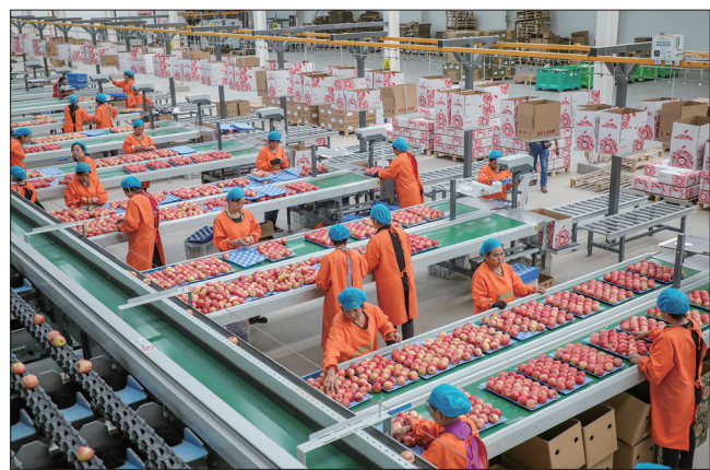
金果小镇的苹果分拣线