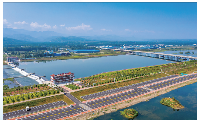
山水田园,秀美洛宁