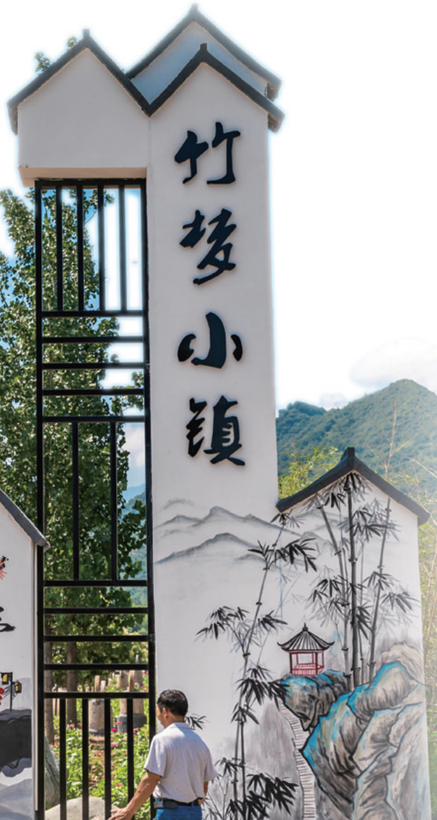
正在建设中的竹梦小镇

“园区依托兴华镇地域特色,规划建设百花园、百草园、奇石园等,将青山、绿水、竹溪与时蔬采摘田园生活相融合。”7月2日,在洛宁县上半年重点项目观摩会兴华竹梦小镇建设现场,该镇负责人介绍。笔者看到,竹梦小镇园区内豆腐宴餐饮区主体已经建成,工人正在忙碌地加紧推进园区休闲观光竹林小径、水系景观池塘、休闲凉亭等基础设施建设。