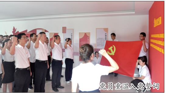
党员重温入党誓词

为庆祝中国共产党成立99周年,认真落实省联社党委和市农信办党组工作要求,6月27日至7月1日,新安农商银行通过党委书记上党课、参观革命历史纪念馆、慰问老党员等多种方式,扎实开展“牢记初心使命 争当先锋模范”系列活动。