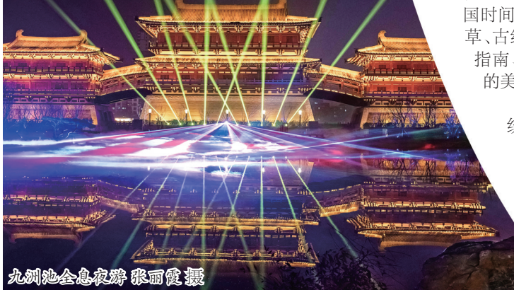
九洲池全息夜游

大家可以关注“玩转隋唐”微信公众号预约购票,或拨打0379-65063201了解购票信息。