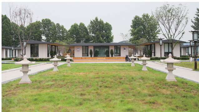
东方博物馆之都研学营地

约报名开展的天街研学课程免费体验;“越夜越有课”天街夜游赠课活动,在7月22日至9月17日,每日19:00至次日12:00,凡在天街研学营地住宿者,都赠送当晚课程;“周三折扣日”活动为今年8月至12月每周三,天街营地住宿及课程将实行八五折优惠。