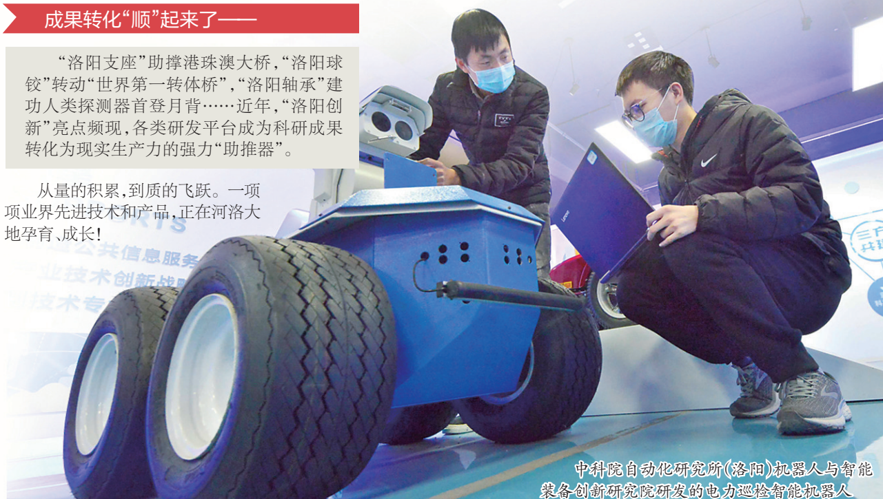
中科院自动化研究所(洛阳)机器人与智能装备创新研究院研发的电力巡检智能机器人