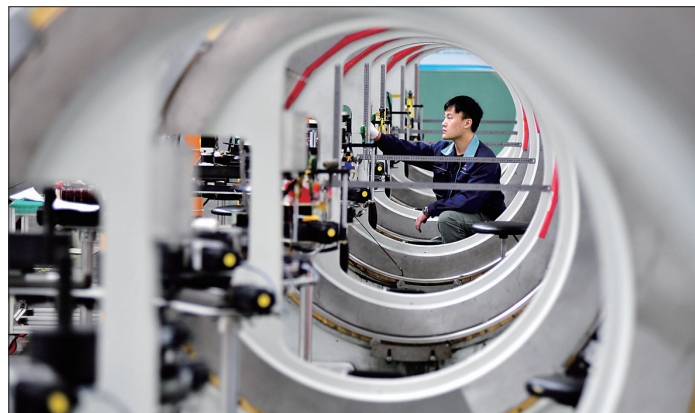
特富特电磁科技(洛阳)有限公司电磁元器件产品销往世界500强企业