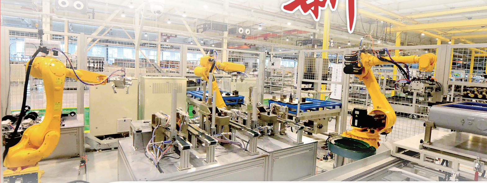
中信重工特种机器人制造智能化工厂