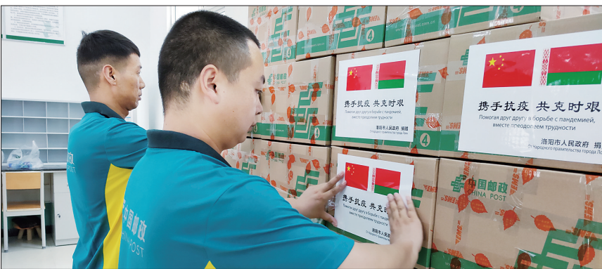
整理防疫物资

洛阳与白俄罗斯有着广泛的经贸往来。2015年5月12日,6家中资企业正式成为中国—白俄罗斯工业园的首批入园企业,其中,就有来自洛阳的中国一拖集团有限公司。2018年5月,由中信重工等三方投资的中信阿姆智能装备有限责任公司进驻该工业园,“洛阳造”特种机器人正式“牵手”白俄罗斯。