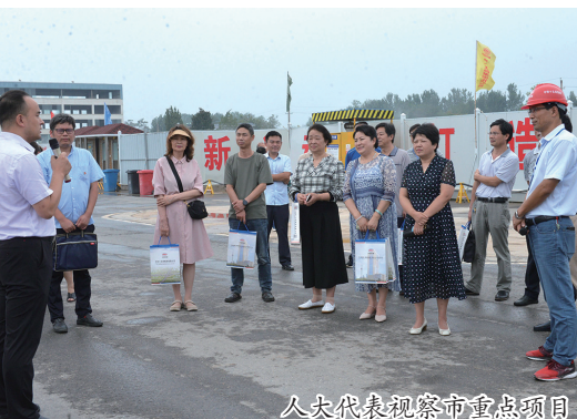
人大代表视察市重点项目

惠民实事等43项专项工作报告,并提出了审议意见。为提高审议质量,区人大常委会在要求有关部门上报专项报告的同时,组织代表提前开展调研,更有针对性地进行审议发言。三是工作评议重在真评。围绕区委中心工作和人大工作重点,以工作评议为切入点,把政府承担重大经济目标任务和关系民生利益的部门列为年度工作评议对象,对被评议单位近两年来的工作进行评议,先后有22个部门接受人大工作评议,有力推动了区委重大决策的贯彻落实和干部职工工作风的转变。