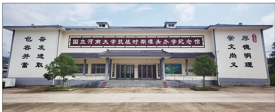
国立河南大学抗战时期潭头办学纪念馆