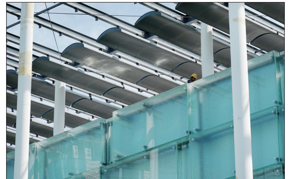
国家体育馆扩建部分玻璃幕墙施工完成

这是8月25日拍摄的国家体育馆扩建部分玻璃幕墙。日前,北京冬奥会北京赛区竞赛场馆国家体育馆扩建部分玻璃幕墙施工完成。同时,扩建部分冰面施工接近尾声。国家体育馆曾是北京2008年奥运会三大主场馆之一,举办过体操、蹦床、轮椅篮球等比赛,现在将变身“双奥场馆”,为举办北京冬奥会男子冰球和女子冰球部分比赛、北京冬奥会冰壶冰球比赛进行改造。