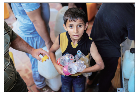
加沙难民营中用水困难