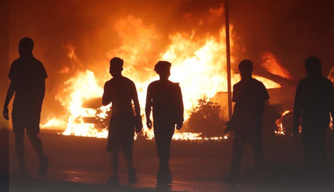
人们以燃烧着的汽车前进

新华社芝加哥8月24日电 美国威斯康星州基诺沙市警察23日开枪击伤一名29岁黑人男子后,已引发连续两天的抗议示威。抗议人群24日一度试图冲入市公共安全大楼新闻发布会现场,警察使用了辣椒喷雾剂驱散人群。