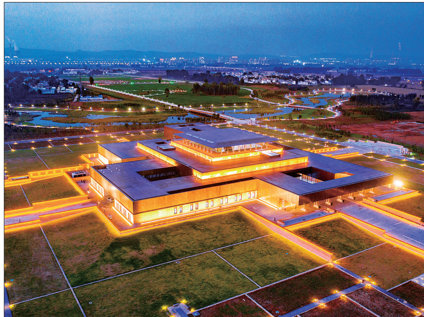
二里头夏都遗址博物馆夜景 (资料图片)

二里头,一个在中国考古史上极为耀眼的名字。自发现以来,这处距今3800年至3500年的遗址不断带给考古人惊喜。学者认为,以中华文明起源的“重瓣花朵”模式论,二里头文化就是“重瓣花朵”的“花心”。