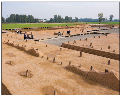
二里头考古遗址公园 (资料图片)

日前,记者穿过碧绿平旷的田野,抵达河南偃师。立于二里头遗址,心中感叹:3000多年前,这座夏代都邑里的先民,可曾想过,其子孙后代竟然成就了今日泱泱大国?