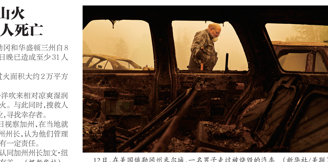
12日,在美国俄勒冈州米尔蒙,一名男子走过被烧毁的汽车

美国太平洋沿岸加利福尼亚、俄勒冈和华盛顿三州自8月初以来山火持续蔓延,截至本月12日晚已造成至少31人死亡。 据路透社报道,美国西海岸山火过火面积大约2万平方公里,涉及6个小镇。 连续4天高温大风天气后,从太平洋吹来相对凉爽湿润的风,消防部门正利用这一有利条件灭火。与此同时,搜救人员携搜救犬沿着过火后的焦黑废墟作业,寻找幸存者。 美国总统唐纳德·特朗普定于14日视察加州,在当地就山火发表讲话。特朗普先前提评这三州州长,认为他们管理森林不善,对山火季蒙受的严重损失负有一定责任。 美国民主党总统候选人乔·拜登则认同加州州长加文·纽瑟姆的看法,认为山火肆虐与气候变化有关。(据新华社)