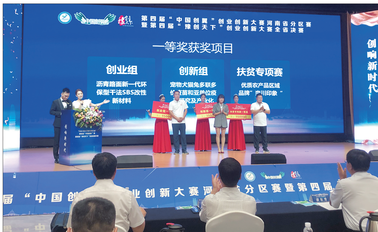
颁奖现场(资料图片)

5月,栾川大器天辰企业孵化服务有限公司、栾川半山企业孵化有限公司、栾川伊晟企业孵化服务有限公司3家市级