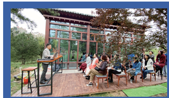
兴洛湖南城市书房公益课

溢坡电影村、十八屯武艺小镇等大力发展近郊特色沟域经济,借势“古都新生活”成为新的网红打卡地,假期总接待游客近30万人次。