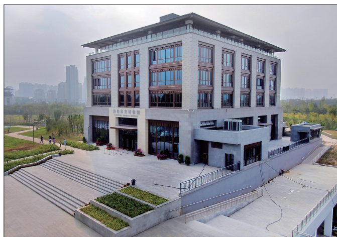
洛阳体育博物馆

市体育局相关负责人表示,洛阳体育博物馆将秉持开门办馆的理念,广泛听取社会各界的意见和建议,进一步完善提升展陈设计,提升馆内设施,突出河洛体育文化主脉,着力讲好河洛体育文化和故事,使其成为挖掘展示体育文化的重要载体、传播普及体育知识的良好平台、引导群众热爱体育的教育基地。