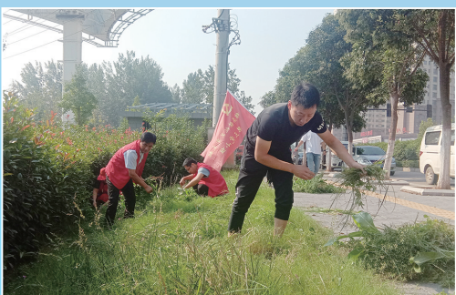
锦屏镇志愿服务队开展清洁家园行动