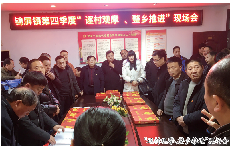
“逐村观摩、整乡推进”现场会

2017年以来，锦屏镇累计投入700万元抓好党建阵地建设。新建漫流、流水沟2个村室，提升改造乔岩、高桥、焦家凹等8个村室，对全镇23个行政村党群服务中心实行统一挂牌并完善村级值班制度，全面建成“三新”讲习所和“党建书屋”，并结合“两学一做”工作安排，定期开展主题党日活动和脱贫攻坚宣讲。以“逐村观摩、整乡推进”活动为抓手，在各村室配备远程教育设备、电脑、打印机、空调等设备，不断提升村级阵地软硬件水平，提升基层党建水平。