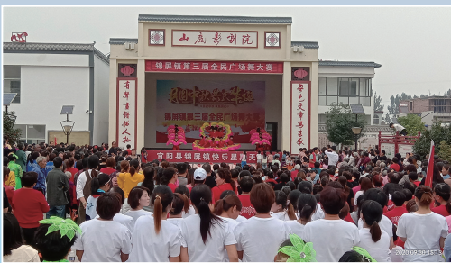
举办丰富多彩的群众文化活动

锦屏巍巍清风来，洛水滔滔祥和起。宜阳县锦屏镇位于锦屏山下、洛水南岸，紧临洛阳市区，是宜阳县城区三大镇之一，也是宜阳东大门。近年，锦屏镇鼓起拉高标杆的勇气，加强奋发向上的冲劲，持续夯实党建堡垒，千群一心凝聚工作合力，推进脱贫攻坚、文明创建等工作持续走向深入，以党的建设高质量促进发展高质量的生动画卷渐次铺展，为洛阳副中心城市建设和打造“富美宜阳”持续贡献“锦屏力量”。