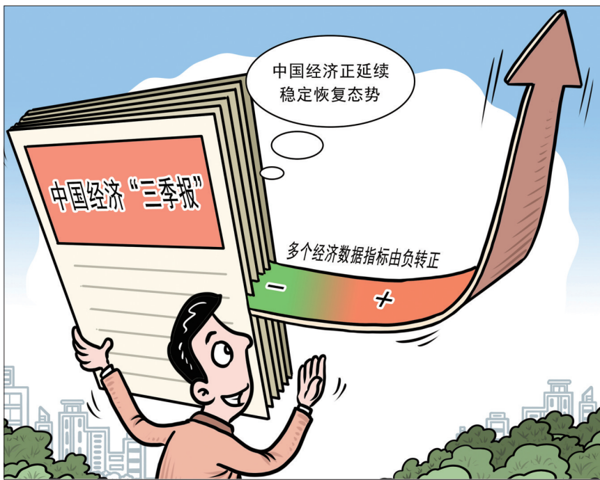
中国经济“三季报” 新华社发 刘道伟 作

核心提示 前三季度经济增长由负转正,GDP同比增长0.7%!三季度经济增速加快,同比增长4.9%!国家统计局10月19日公布三季度经济数据,多个指标由负转正表明中国经济正延续稳定恢复态势。“新华视点”记者采访专家学者,通过关键数据透视中国经济“三季报”。