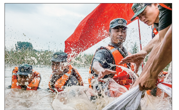
第71集团军某旅官兵在江西省九江市彭泽县芙蓉墩镇沿江大道东堤封堵管涌(7月13日摄)

一个前进的时代,总有一种奋发向上的意志力量;一个复兴的民族,总有一种赓续传承的精神禀赋。