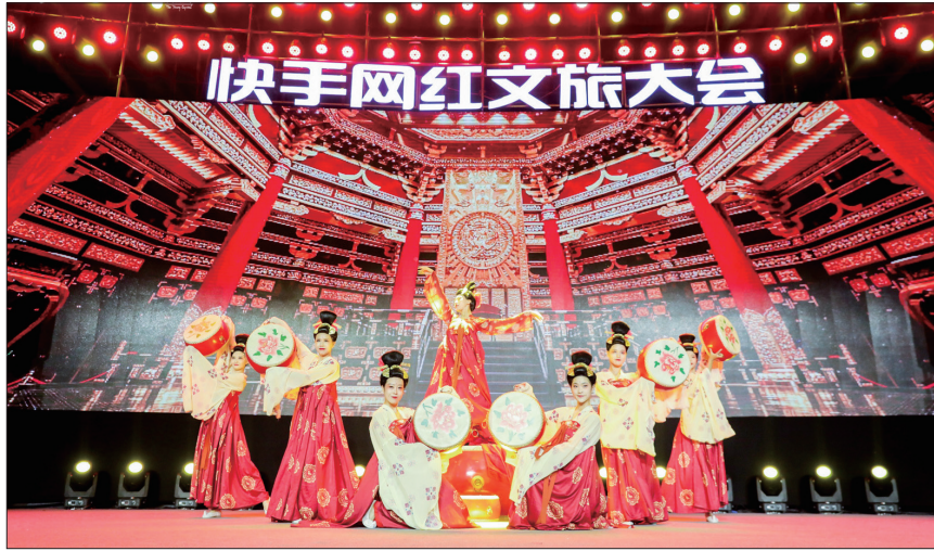
快手网红文旅大会开幕式现场

今年7月,快手上线了“快拍洛阳”等一系列活动引导用户创作短视频,并邀请300多名文旅创作者分组走进我市核心文化旅游景区,全方位开展景点打卡,以“短视频+直播”的方式和百花齐放的创意,推介不一样的网红洛阳,引发了全网对洛阳城市和文旅资源的极大关注。快手达人宣传推介网友自