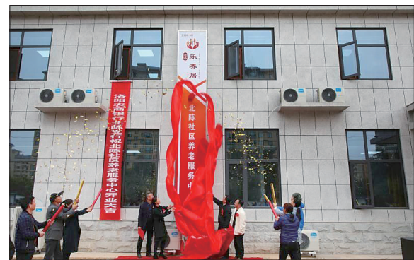
北陈社区“乐养居”交付使用

本报讯(记者 余子愚 通讯员 杨茹兰)昨日,记者从吉利区民政局获悉,吉利区北陈社区、西霞社区、吉利社区、冶成社区“乐养居”(社区养老服务中心)于10月30日同时交付使用。