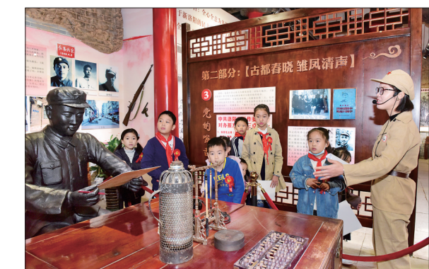
童心向党 逐梦前行

10月31日,洛阳市红领巾校外活动基地揭牌暨洛阳日报社少儿书画大赛颁奖活动在《新洛报》旧址纪念馆举行。