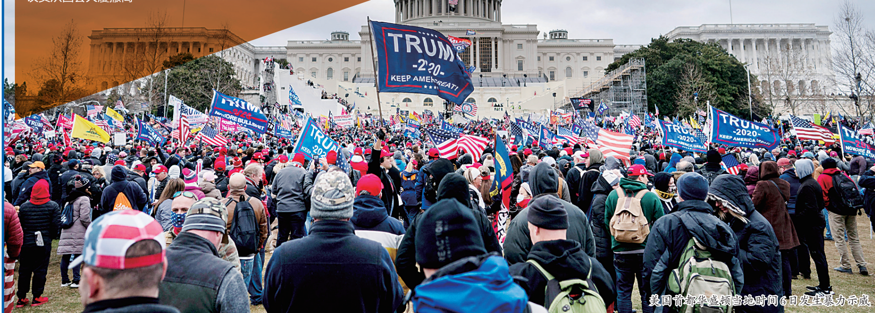
美国首都华盛顿当地时间6日发生暴力示威

亚足联在一份声明中说,相比为期28天的2019年阿联酋亚洲杯,2023年中国亚洲杯将持续31天,将是赛事历史上时长最长的一届。这一调整旨在让参赛球队有充裕的时间恢复体力并往返于赛区之间。