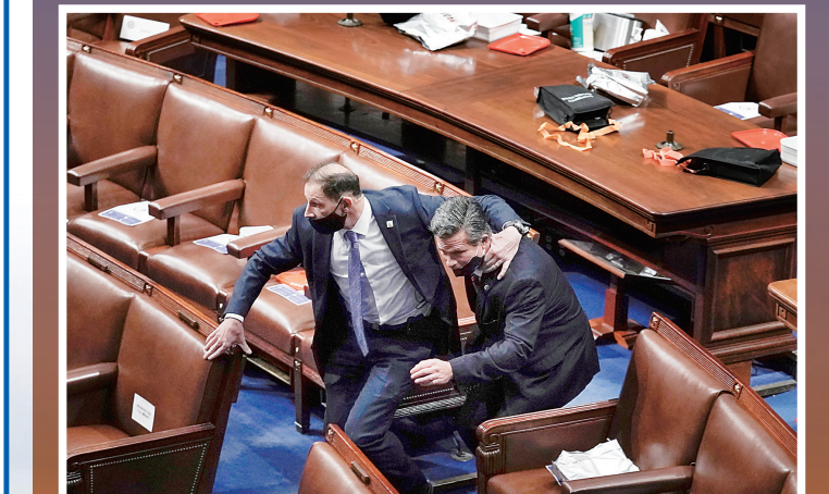
议员从国会大厦撤离