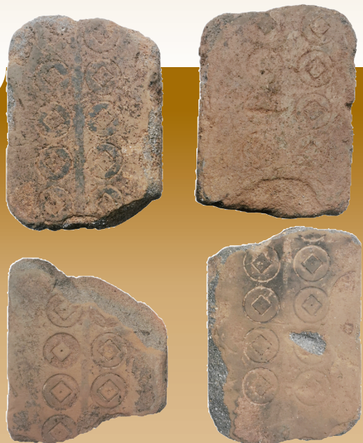
西汉陶质五铢钱范