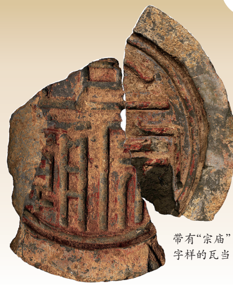
带有“宗庙”字样的瓦当

正是文献中记载的西起阊阖门、东至建春门的大道,2500多米长的道路是朝堂与后宫的“分界线”