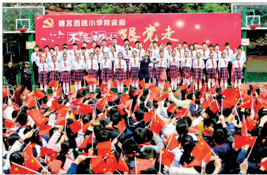
爱国主义主题教育活动

在党建工作引领下,学校以“教育即服务,学习即生活,在体验中奠基真善美的品质人生”为办学理念,以“办让学生向往、家长期盼、同行