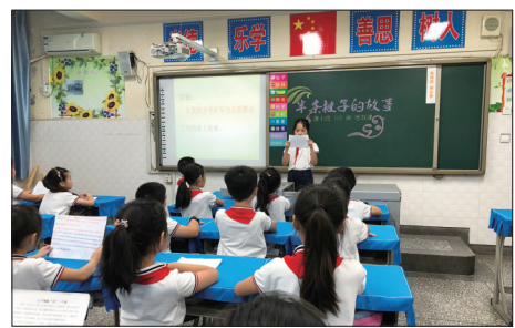
《半条被子的故事》思政讨论课

将思政教育落实到具体课堂中,开展《半条被子的故事》思政讨论。孩子们观看了《半条被子的故事》视频,了解了故事发生的时代背景,分享了自己课下搜集的有关红军的故事……他们表示,要联系自身,从小事做起,从小立志,长大做社会的栋梁。