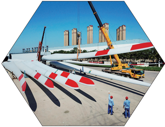
双瑞风电叶片畅销全国