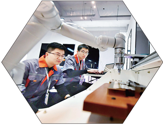
尚奇公司研发新一代协作机器人