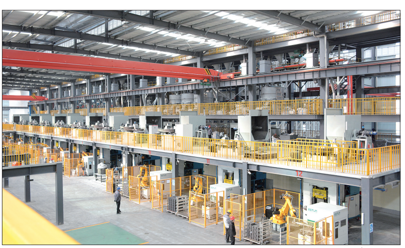
洛阳利尔特种陶瓷

葛寨镇烟云洞青铜小镇传统工艺与人文资源相得益彰;城关镇洛阳龙凤山古镇景区惊艳亮相;彭婆镇产城融合示范区机械轰鸣,筑巢引凤;白沙镇绿色铸造产业园企业纷纷进驻;鹤岭镇岭上碾薯干亩示范基地项目育苗正当时;县城南部片区提升改造项目加快推进……近日,伊川县召开观摩现场会,对36个重点项目进行“检阅”,为推进乡村振兴下足功夫。风正帆满春潮涌,“十四五”时期,伊川县将着力打造全国重要的新材料产业创新绿色发展示范基地、洛阳国家物流枢纽重要节点、洛阳近郊生态文化旅游目的地、河南省现代农业发展引领区。立足新发展阶段,贯彻新发展理念,融入新发展格局,伊川县以项目建设为抓手,全力推动各项工作稳步开展,努力在新征程上开创伊川高质量发展新局面。项目建设高质量。各乡镇(街道)把工业发展、财税建设作为主抓手,思路清晰,布局合理。彭婆、白沙、水寨等镇工业项目加快推进,吕店工业园区、平等食品园区正加快招商、全面推进,