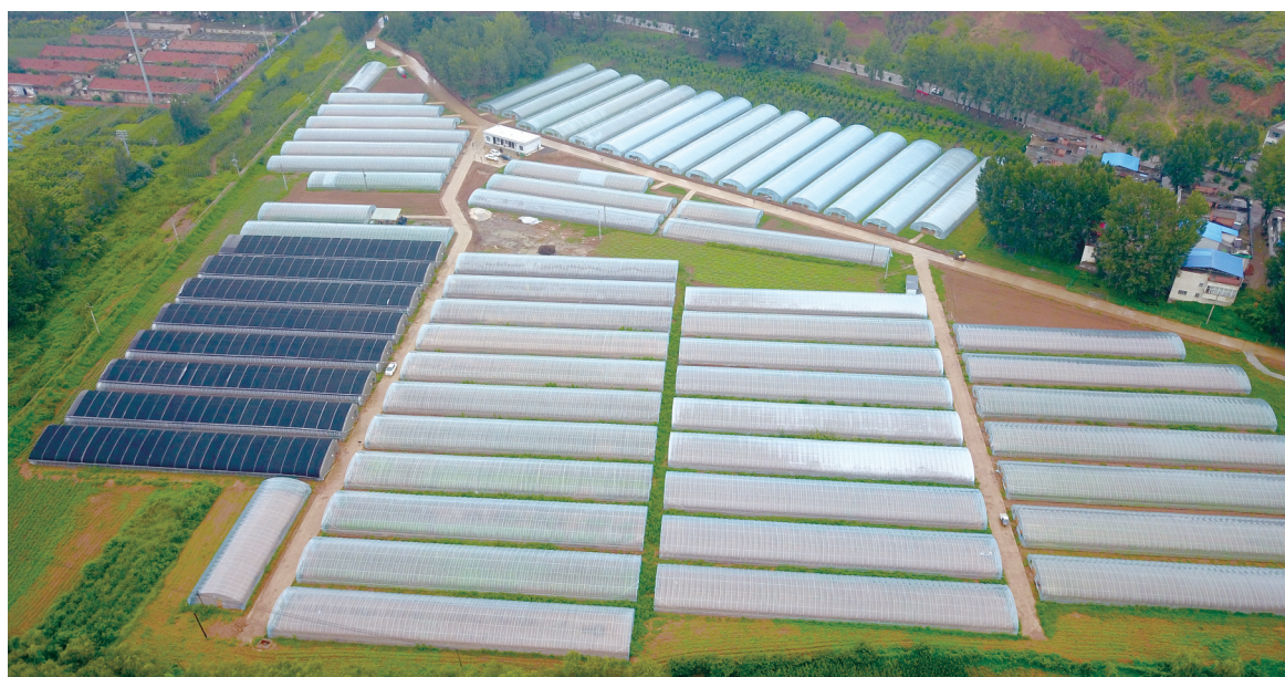
柏树乡华沟蔬菜基地

近年来,汝阳县以党建为引领,坚持发展村级集体经济与脱贫攻坚相结合、与农业产业发展相结合、与促进农村劳动力就业相结合,大力发展村级集体经济,为乡村振兴夯实产业基础。