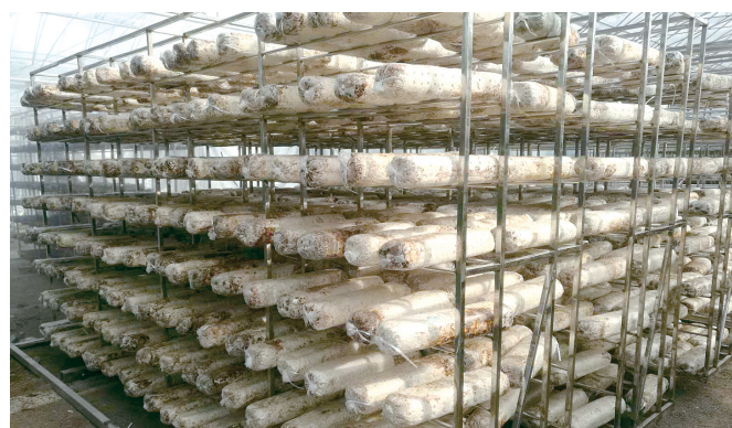
十八盘乡刘沟村汝阳香菇基地