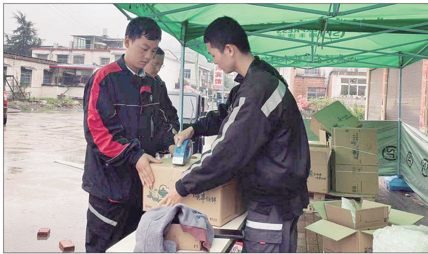
农产品从产地附近直接通过快递发出

记者从中国邮政集团公司洛阳市分公司(简称洛阳邮政公司)了解到,近年,在“以农为本、为农服务、靠农兴邮”理念的支持下,洛阳邮政公司在农村农村地区已建成农村邮政支局141个,开通农村邮路60条,段道254条,实现了所有乡镇设所、村村通邮。