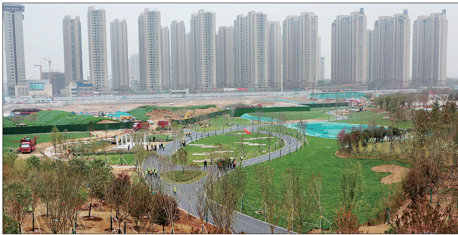
隋唐大运河国家文化公园东区局部,图中绿化区域具备开放条件

从规划设计方案上看,隋唐大运河国家文化公园亮点颇多。拿东区来说,这个总面积近20万平方米的区域,将修建一条按比例缩小的“隋唐大运河”——运河历史文化步