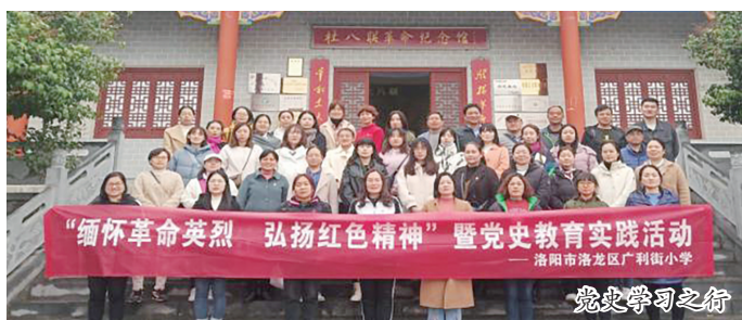
“缅怀革命先烈 弘扬红色精神”暨党史学习教育实践活动 ——洛阳市洛龙区广利街小学 党史学习之行

“蜜蜂文化”引领下的德育课程,培养了孩子们健全的人格,给学生提供了一方奋发向上、快乐成长的天地,让广小学子如蜜蜂一样勤劳执着,不断耕耘,不断收获。