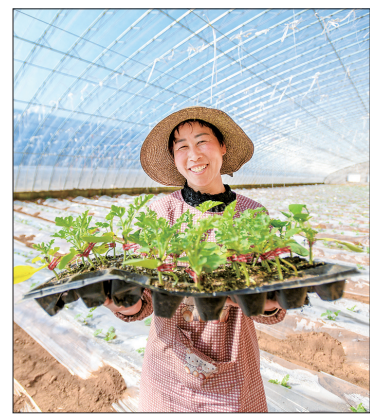
孟津区西瓜育苗大棚,农户正展示幼苗