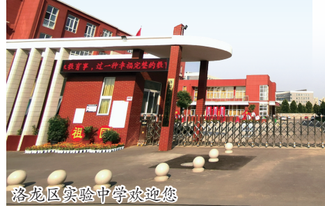
洛龙区实验中学欢迎您

建党百年,“红船精神”指引着教育工作者赓续奋进,乘风破浪。坐落于关林路与学府街交叉口东南角的洛阳市洛龙区实验中学是一所完全公办初中,于2018年建成投用。该校环境优美,设施齐全,师资力量雄厚,文化氛围宜人,是一所充满生机和希望的学校。目前该校有13个教学班,627名学生,50名教师。教师平均年龄31岁,均为本科以上学历(研究生5人),省名师2人,省市区级骨干教师、优秀教师(班主任)16人,省市级优质课获奖教师34人。他们经验与知识共有,热情与耐心兼备,一路陪伴孩子们学习知识,健康成长。