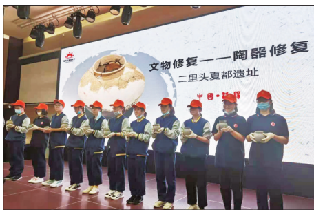
展示修复完成的器物 (本文配图均为资料图片)