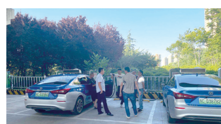
工作人员现场为充电用户解答问题