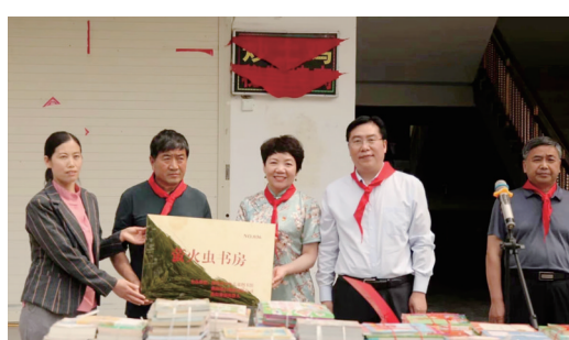
洛阳银行捐赠第34座“萤火虫书房”,照亮孩子成长路

该行在抓好专题学习的基础上,围绕百年党史主题,邀请专家作专题宣讲;积极开展现场体