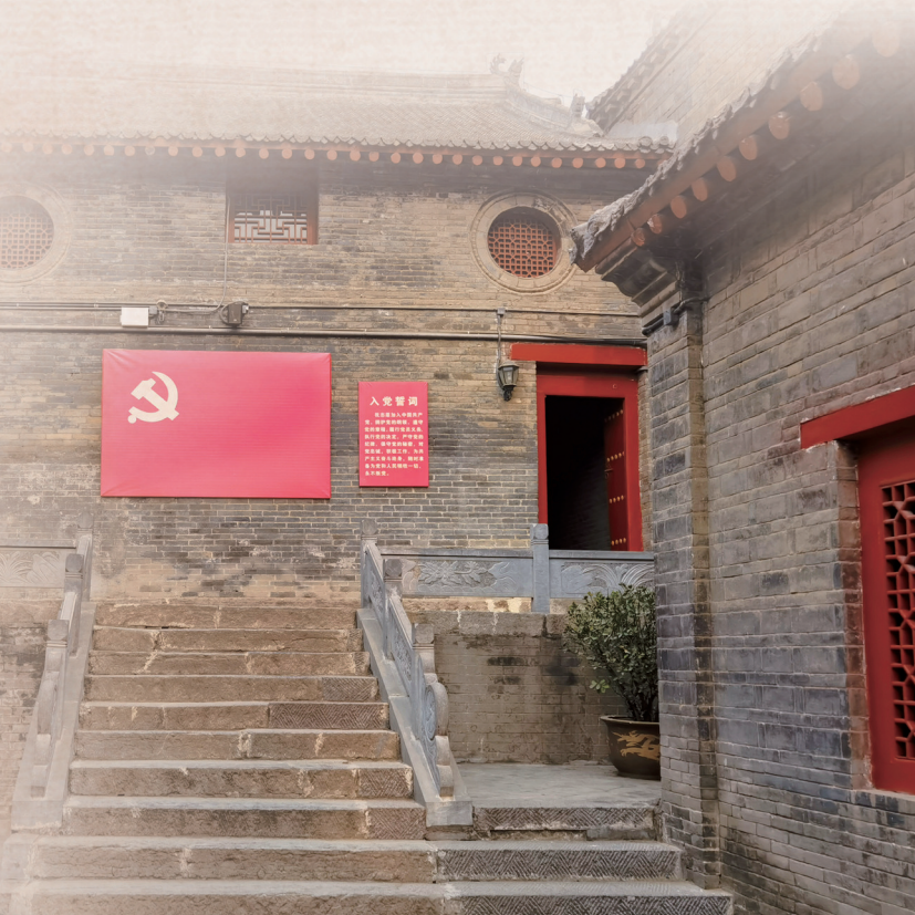
八路军驻洛办事处纪念馆