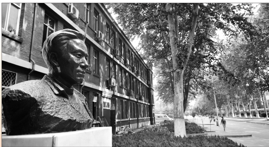
中信重工“焦裕禄大道”