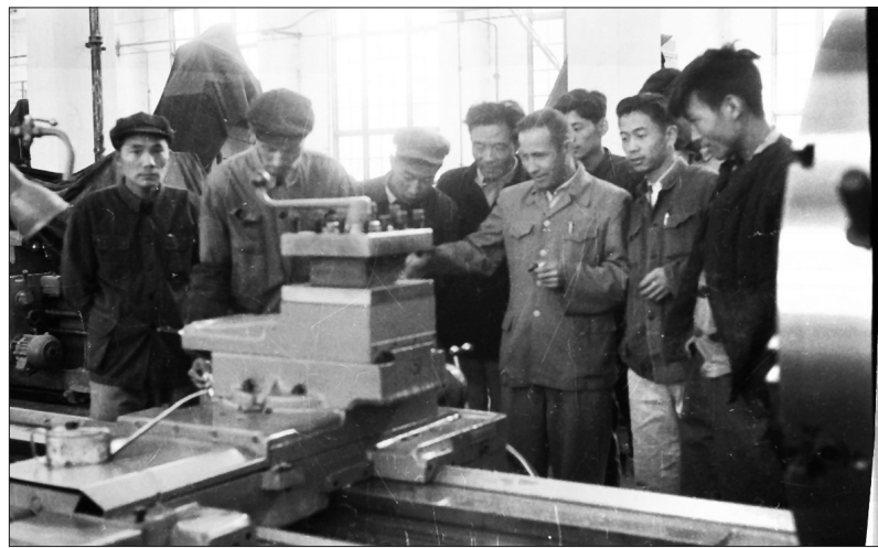
焦裕禄(左四)与苏联专家雅辛斯基检查机床设备