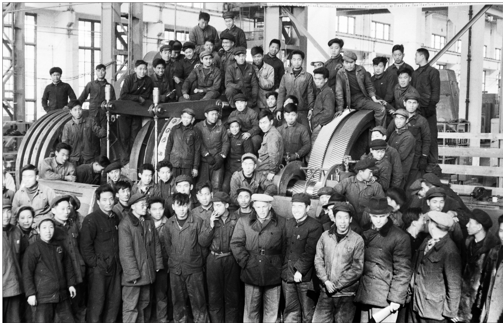
1958年9月,洛阳矿山机器厂生产出中国第一台2.5米卷扬机,苏联专家与干部、工人合影(前排左三是车间主任焦裕禄)

习近平总书记曾说过:“焦裕禄精神孕育形成在洛矿,弘扬光大在兰考。我们这一代人都深受焦裕禄精神的影响,是在焦裕禄事迹教育下成长的。”