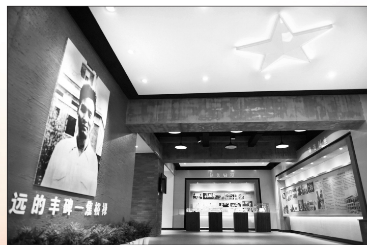
中信重工设立的“焦裕禄事迹展览馆”