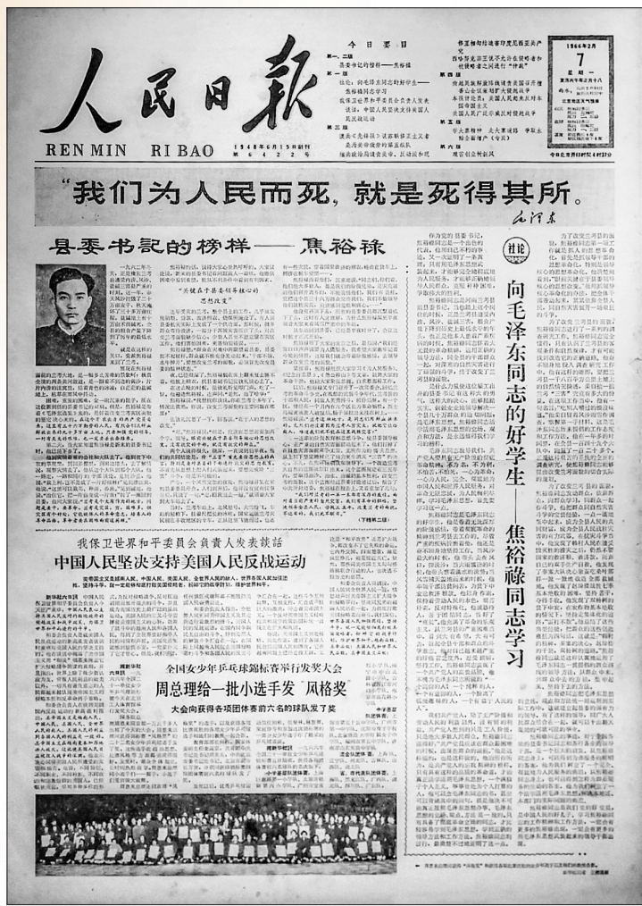
《人民日报》1966年2月7日头版刊发长篇通讯《县委书记的榜样——焦裕禄》并配发社论《向毛泽东同志的好学生——焦裕禄同志学习》