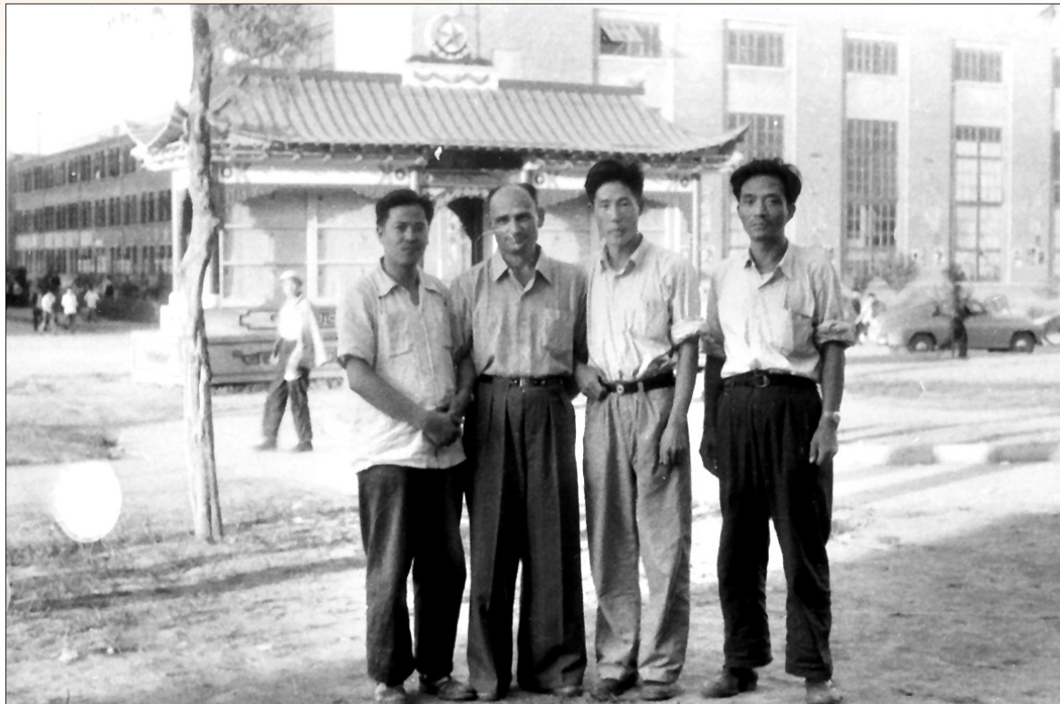
焦裕禄(右一)和苏联专家在一起