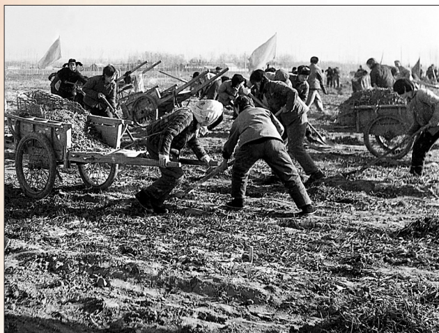
1977年，现孟津区吉利片区所在的黄河北岸区域举行公路建设会战