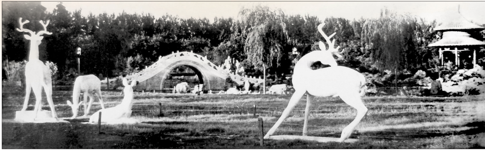
20世纪70年代末的西苑公园