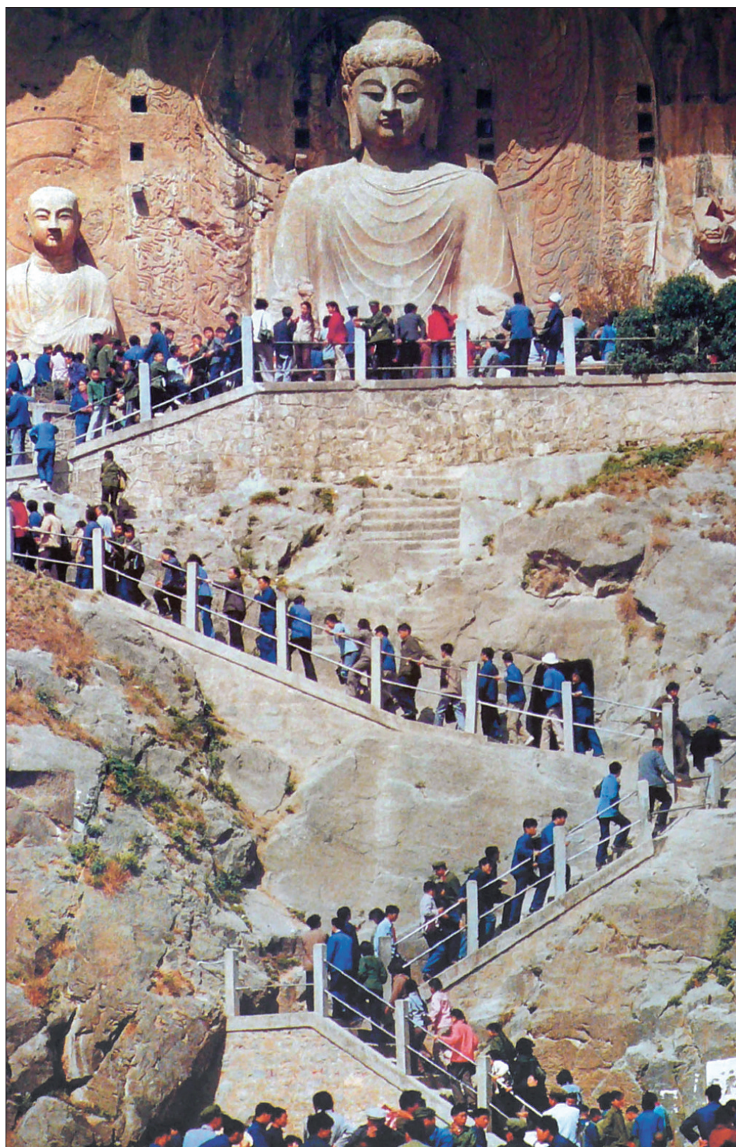
龙门石窟卢舍那大佛前，1972年修建的“之”字形步梯