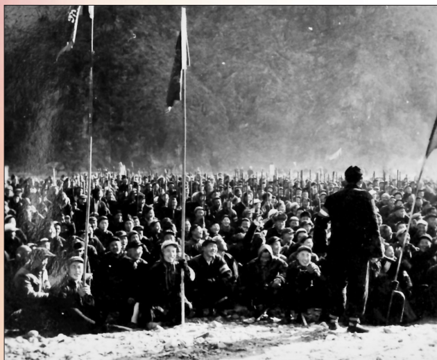
陆浑水库始建于1959年12月31日，1965年8月建成。图为开工典礼现场