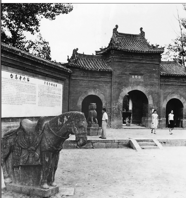
20世纪60年代的白马寺大门