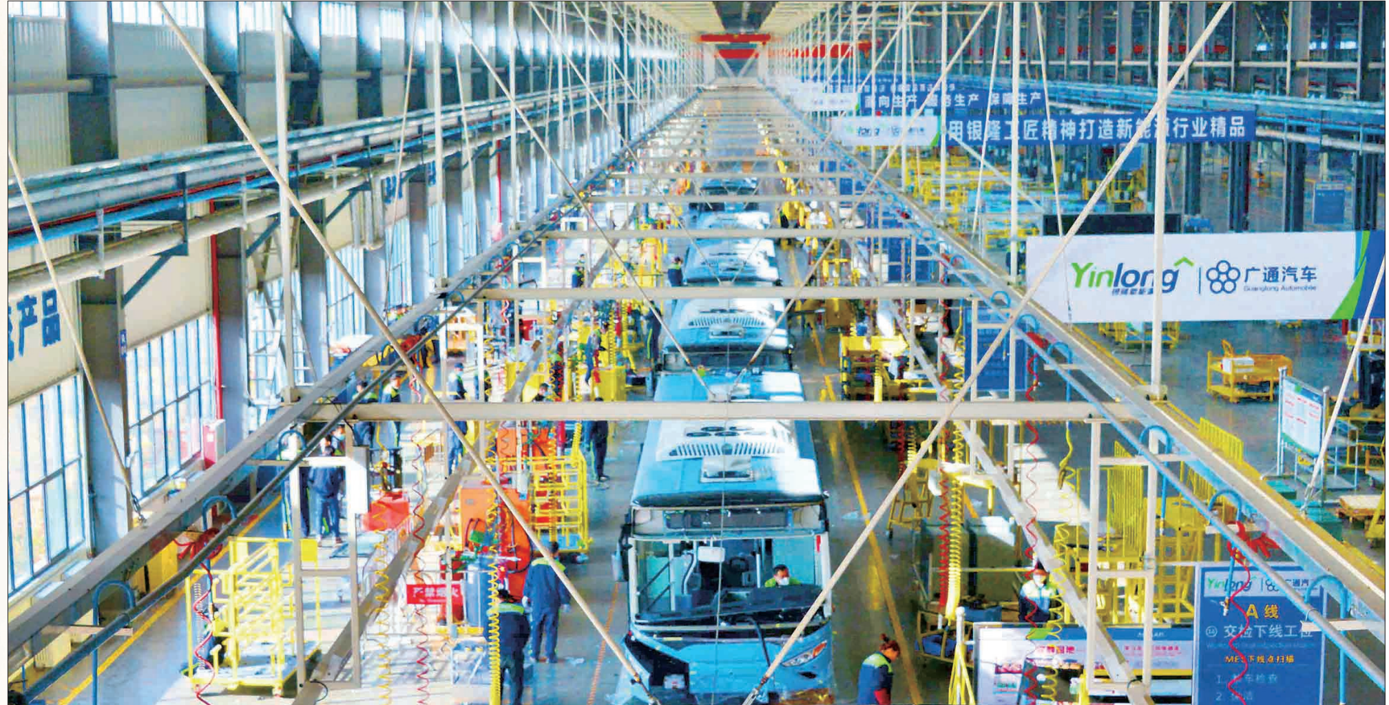
洛阳银隆新能源公交车下线