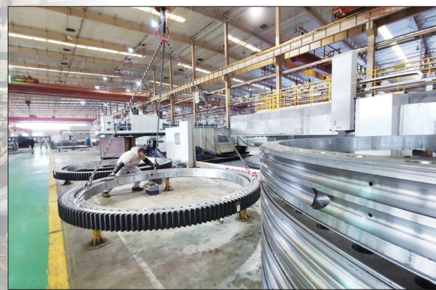
洛轴造出大型风电轴承