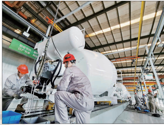
中集凌宇打造一流绿色智能搅拌车生产线