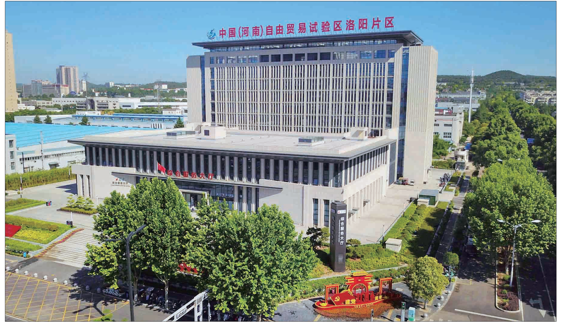
自贸区洛阳片区打造特色鲜明的人才特区和创业创新高地