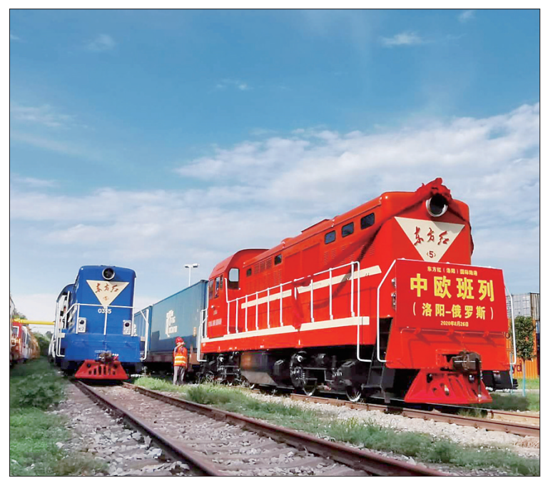
洛阳首趟中欧班列开行