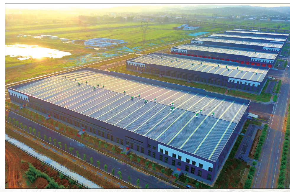
洛阳综合保税区(一期)物流仓库