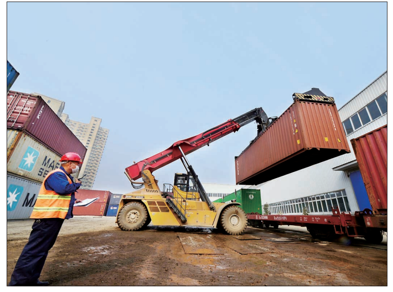
位于中国一拖铁路编组站的洛阳陆港多式联运物流中心