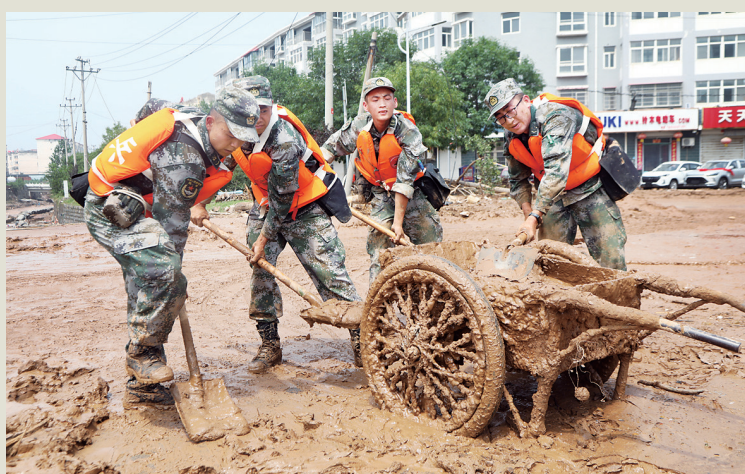
7月24日,救援官兵在巩义市小关镇清理道路淤泥

据新华社郑州7月25日电 国家防总秘书长、应急管理部副部长兼水利部副部长周学文24日率国家防总工作组,在河南郑州、鹤壁、安阳等地,继续深入一线指导防汛救灾工作。