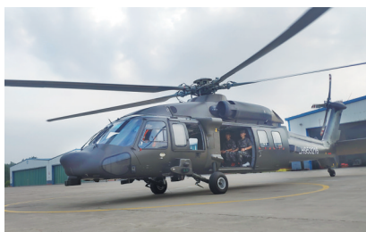
直-20直升机飞行前准备

据新华社郑州7月25日电 连日来,河南省新乡市遭遇罕见汛情,第83集团军某旅闻令而动,出动3架直-20直升机赶赴灾区一线,执行空中勘察和空投救援物资等任务。