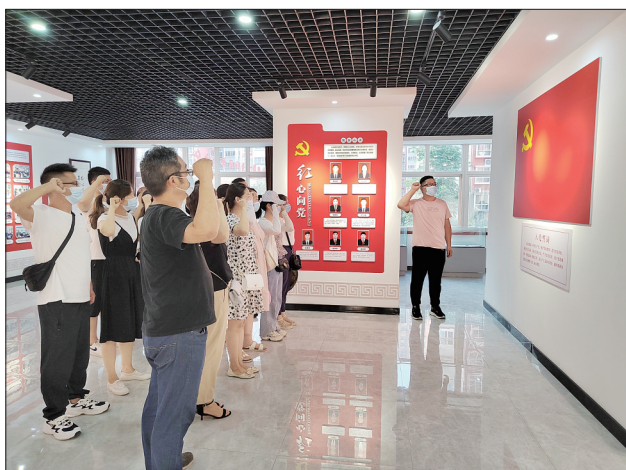
西霞院街道组织党员到辖区家风家训馆参观并重温入党誓词

日前,孟津区西霞院街道党工委组织所辖12个社区开展了一系列“传承好家风、筑牢廉洁墙”活动。12个社区的“三委”干部同家属一起,到东杨新村家风馆参观学习。随后,西霞院街道党工委开展了“老红军讲述革命故事,新少年树立远大理想”座谈活动,让群众在聆听中感悟正确的人生观和价值观。在家风家训交流会上,大家畅所欲言,通过相互交流,取长补短,广大干部、职工又经历了一场廉政洗礼。