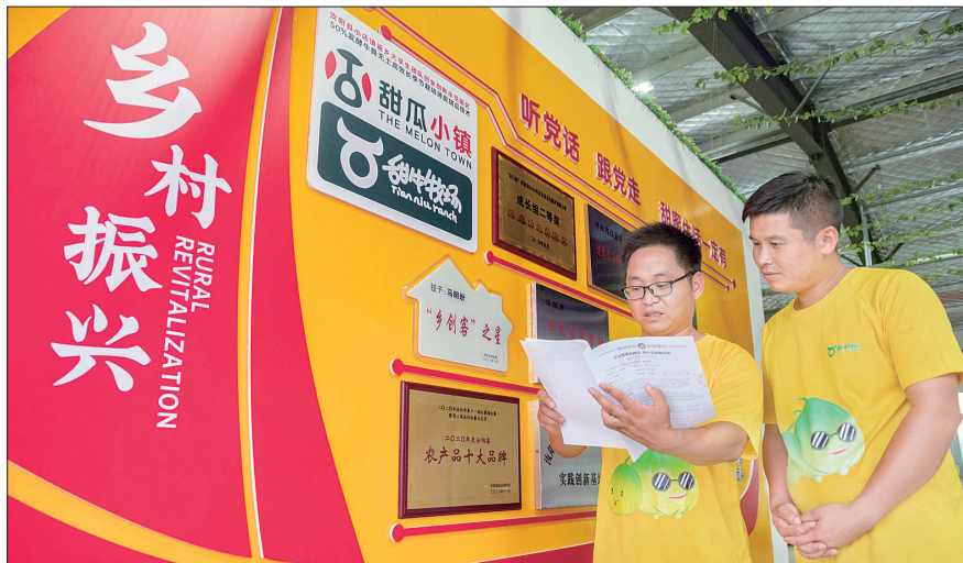
创业团队讨论问题