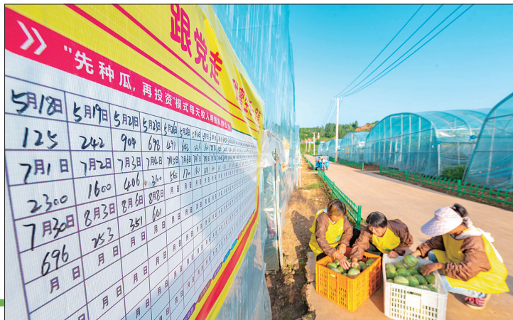
“先种瓜，再投资”模式助农增收