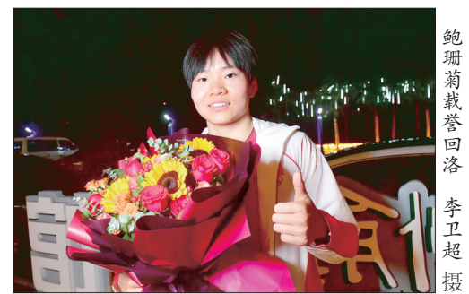
鲍珊菊载誉回洛

本报讯（记者 孟山）昨晚，东京奥运会冠军鲍珊菊载誉回到洛阳。经过短暂休整后，9月上旬，她将在家乡父老面前亮相全运会场地自行车赛场。