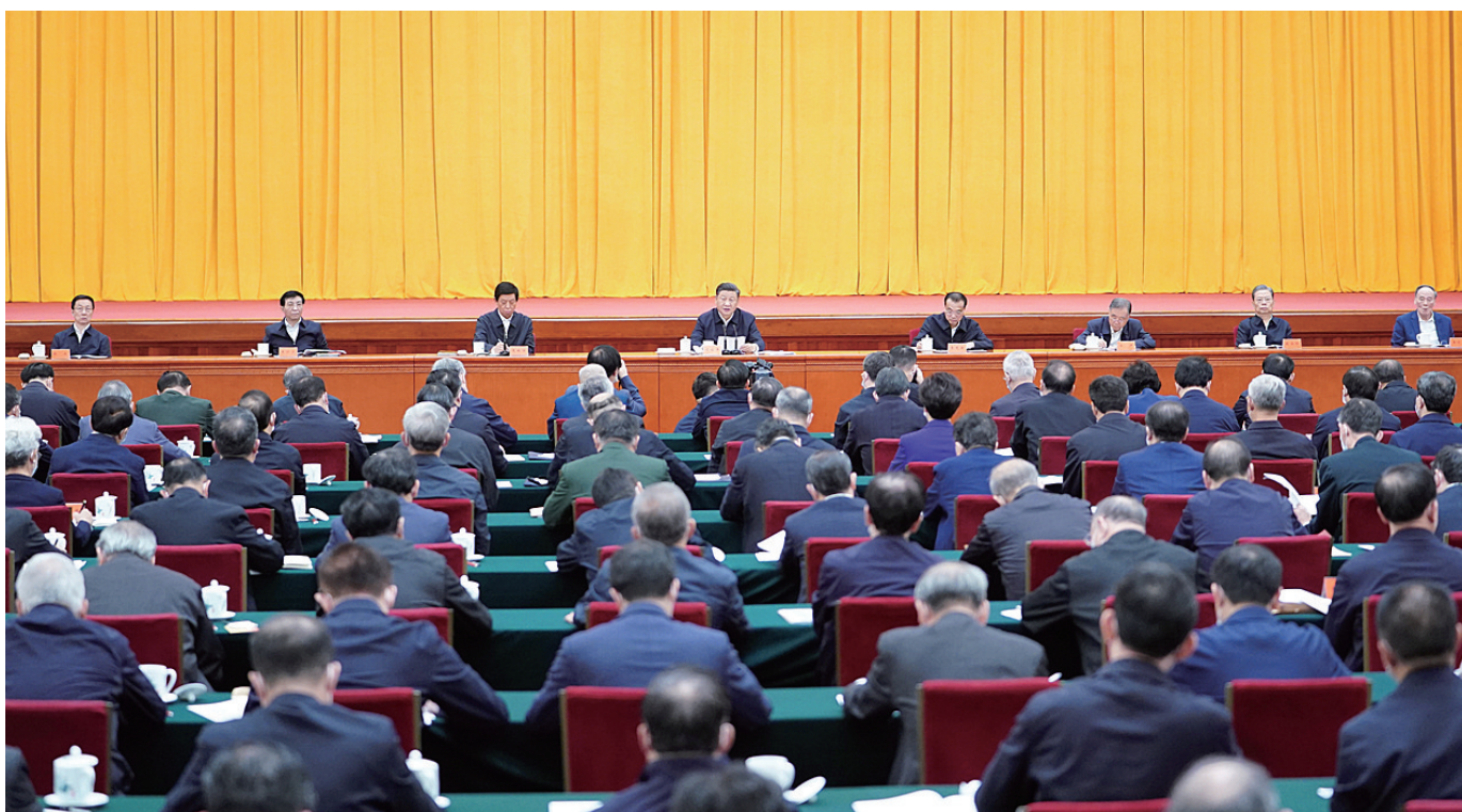
10月13日至14日,中央人大工作会议在北京召开。中共中央总书记、国家主席、中央军委主席习近平出席会议并发表重要讲话。李克强、栗战书、汪洋、王沪宁、赵乐际、韩正、王岐山出席会议。

新华社北京10月14日电 中央人大工作会议10月13日至14日在北京召开。中共中央总书记、国家主席、中央军委主席习近平出席会议并发表重要讲话,强调人民代表大会制度是符合我国国情和实际、体现社会主义国家性质、保证人民当家作主、保障实现中华民族伟大复兴的好制度,是我们党领导人民在人类政治制度史上的伟大创造,是在我国政治发展史乃至世界政治发展史上具有重大意义的全新政治制度。我们要坚持中国特色社会主义政治发展道路,坚持和完善人民代表大会制度,加强和改进新时代人大工作,不断发展全过程人民民主,巩固和发展