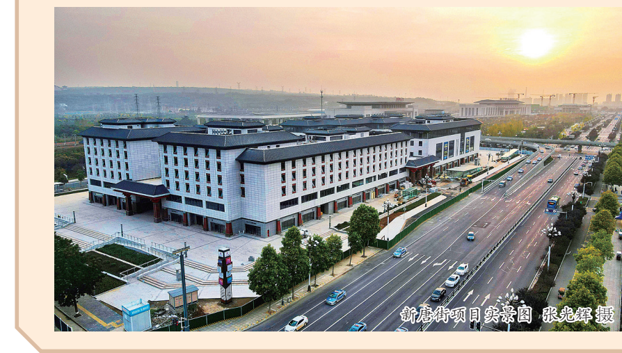
新唐街项目实景图

今年以来,洛阳旅游发展集团有限公司(简称洛阳旅发集团)牢牢把握洛阳“建强副中心、形成增长极”的重大机遇,从全国大格局、以国际大视野审视洛阳文旅产业,积极探索文旅融合新路径,多元拓展文化旅游产业,坚持“项目为王”,常态化谋划推进“三个一批”重大项目,凝聚起推动文化旅游融合发展的“硬核力量”。