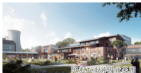
阳苑工业游园效果图

作为洛阳市现代轴线最高的建筑,牡丹博物馆通高69米,是国内唯一的牡丹专题博物馆。预计博物馆馆藏文物超过500件,有上至唐宋下至明清的精美瓷器、砖雕、织锦、字画,也有牡丹邮票等近代生活用品。此外,博物馆在“文化+创意”上大做文