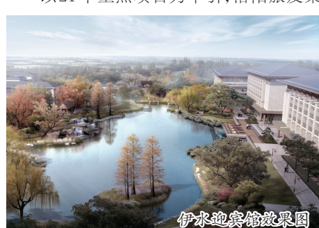
伊水迎宾馆效果图

品牌就是品质品位,就是吸引力竞争力。以21个重点项目为牵引,洛阳旅发集团不断强化保障,着眼打造一批立得住、叫得响、传得开的知名品牌,压茬推进项目建设,催生全市文旅融合发展的新亮点、新气象。