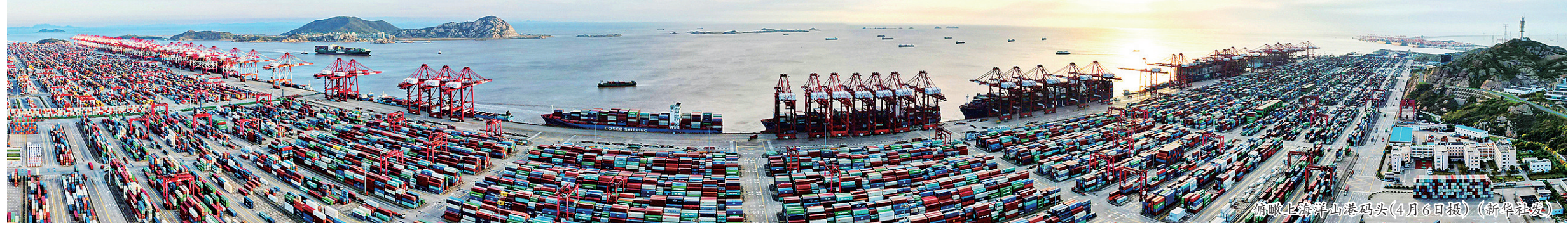
俯瞰上海浦东山港码头(4月6日摄)