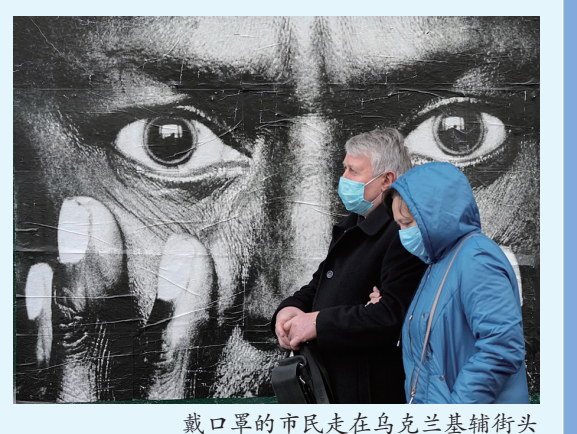
戴口罩的市民走在乌克兰基辅街头