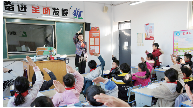
如流,不仅得到了文具奖励,也把课程内容牢记于心。

“红领巾是红旗的一角,象征着革命先烈的鲜血换来的胜利来之不易。”“队礼五指并拢举过头顶,表示人民的利益高于一切。”……课程接近尾声,在互动抢答环节,孩子们踊跃举手、对答