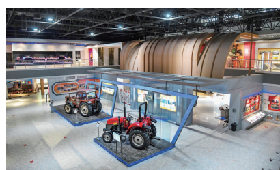
东方红农耕博物馆